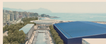
Genova, Italia . La trasformazione del waterfront genovese è un progetto a lungo termine che coinvolge pubblico e privati