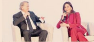
Panel discussion, con Daniela Santanchè e il ministro del Turismo, Giancarlo Giorgetti, in alto a destra, e il presidente della Regione Liguria, Giovanni Toti, in basso a sinistra.

Il Forum di Genova, Santanchè e il ministro del Turismo, Giancarlo Giorgetti, in alto a destra, e il presidente della Regione Liguria, Giovanni Toti, in basso a sinistra.